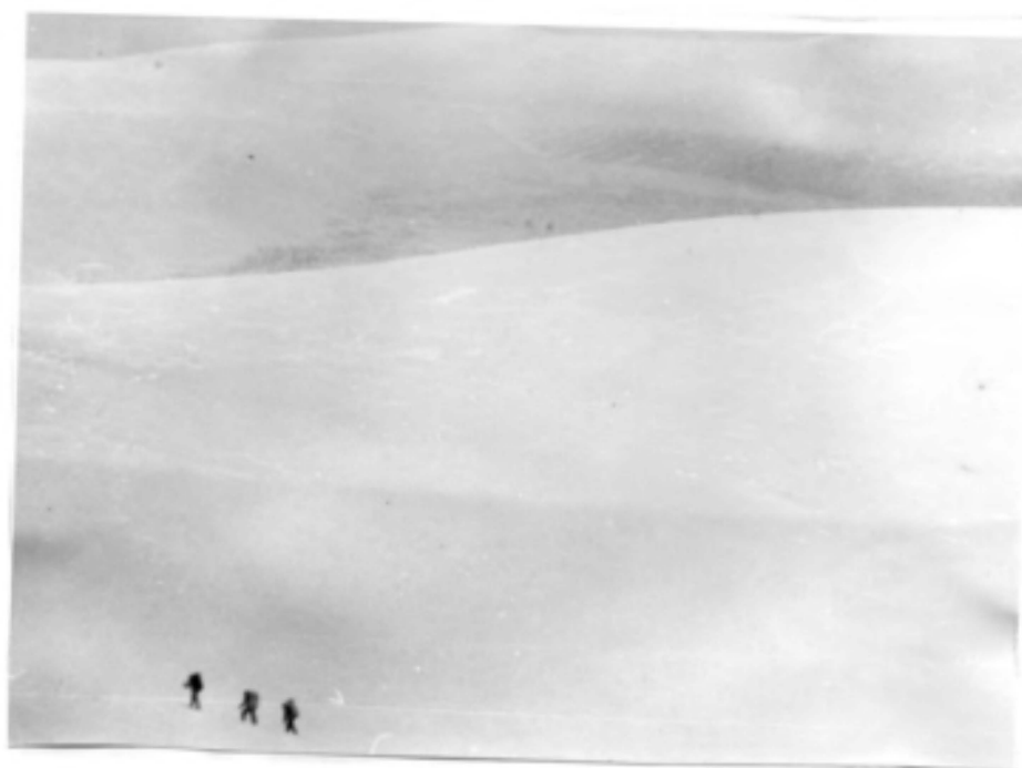
6. Подъём из долины Лозьвы к перевалу Дятлова